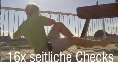
16x seitliche Checks