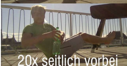
20x seitlich vorbei