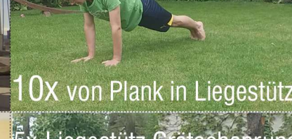
10x von Plank in Liegestütz