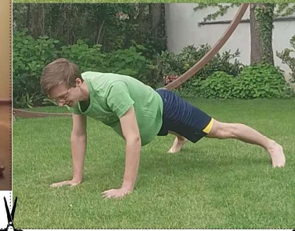
5x Liegestütz Grätschsprung